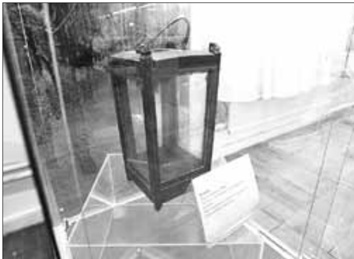
■ На выставке представлены уличные фонари начала XX века