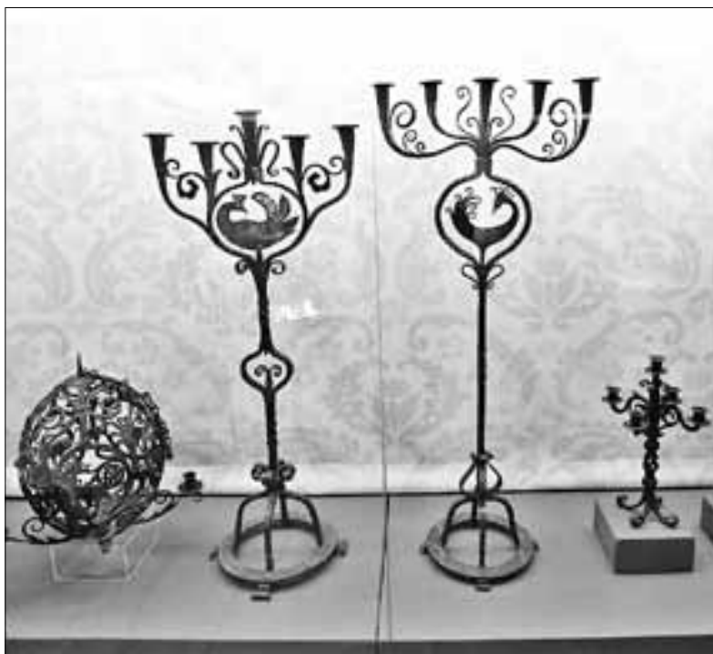
■ Подсвечники на выставке самые разные – большие и маленькие, простые и напоминающие произведение искусства

лампу «Рыцарский кубок». Она так называется, потому что, во-первых, сделана в виде кубка, а во вторых, у нее на крышке изображены рыцарские шлемы с закрытыми забралами. По бокам – изображения собора и двух рыцарских замков с поясняющими рельефными надписями: Эрфуртский кафедральный собор Богоматери, крепость в Кобурге и замок в Айзенахе.