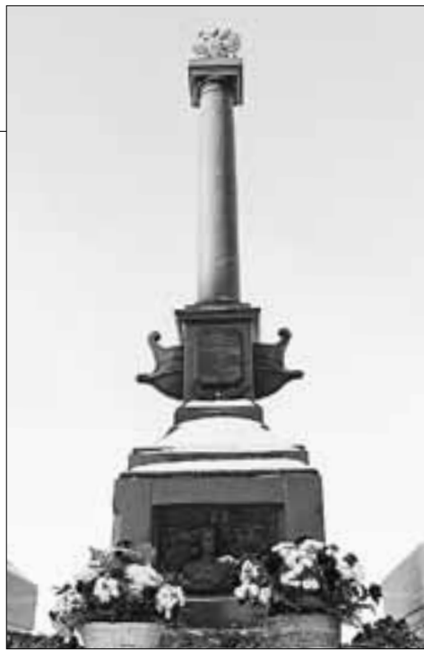
■ ФОТОРЕПОРТАЖ: ПРЕСС-СЛУЖБА АДМИНИСТРАЦИИ ГОРОДА