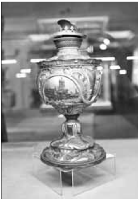
■ Лампа «Рыцарский кубок»