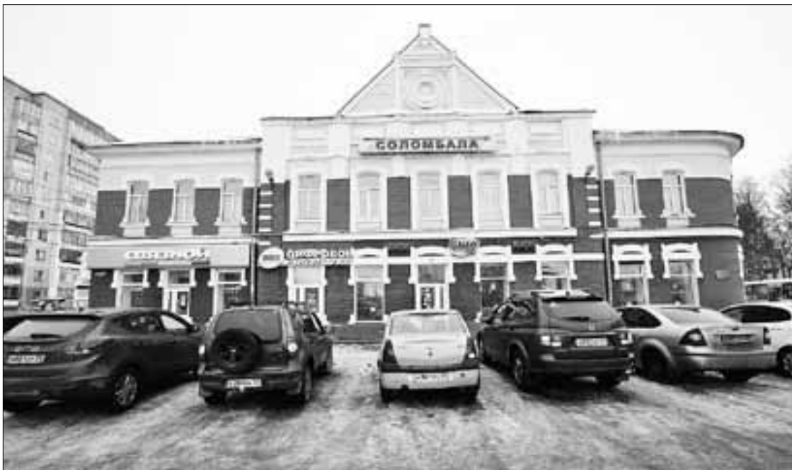
■ Сегодняшний облик торгового дома купцов Макаровых