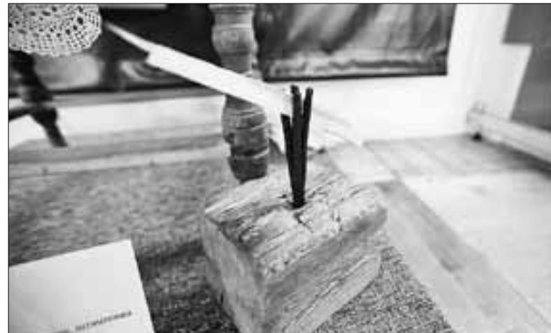
■ В деревенском быту на протяжении долгого времени основным источником света была лучина