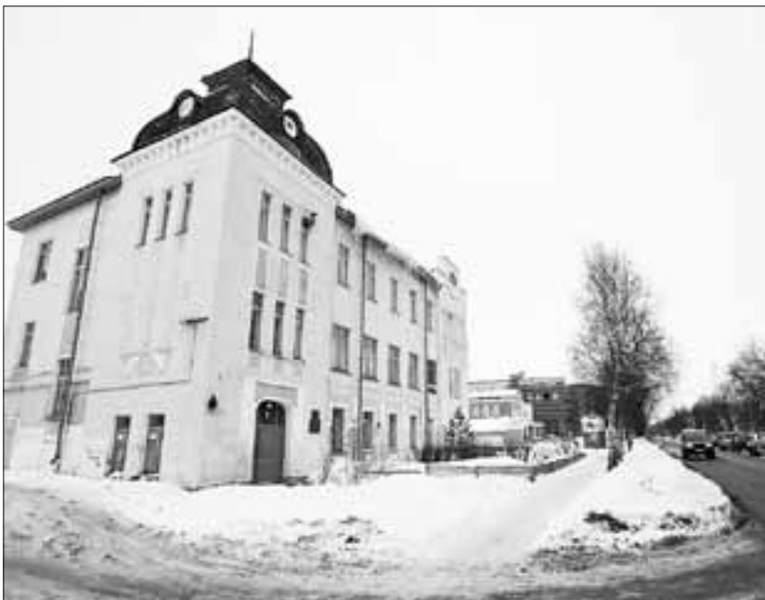
■ Дом № 3 – памятник градостроительства и архитектуры

Знают ли соломбальцы, кто такой Терехин?