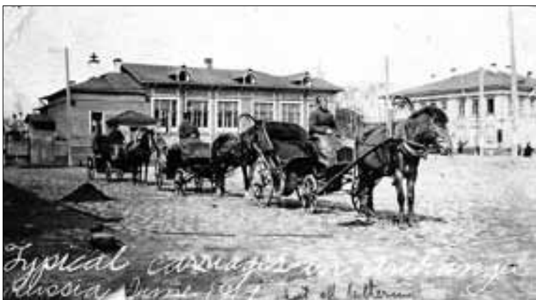
■ Снимок, сделанный американцем в июне 1919 года.

– В моем детстве, это начало 1950-х годов, и сама площадь, и дорога по улице Терехина были вымощены булыжником. На площади постоянно проходили различные демонстрации, всегда было шумно и