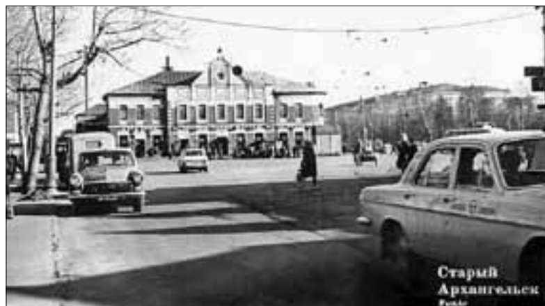
■ Площадь Терехина в советские годы.

Кроме того, на улице Терехина есть еще одно исторически важное здание. Табличка на доме № 3, который является памятником градостроительства и архитектуры и объектом культурного и регио-