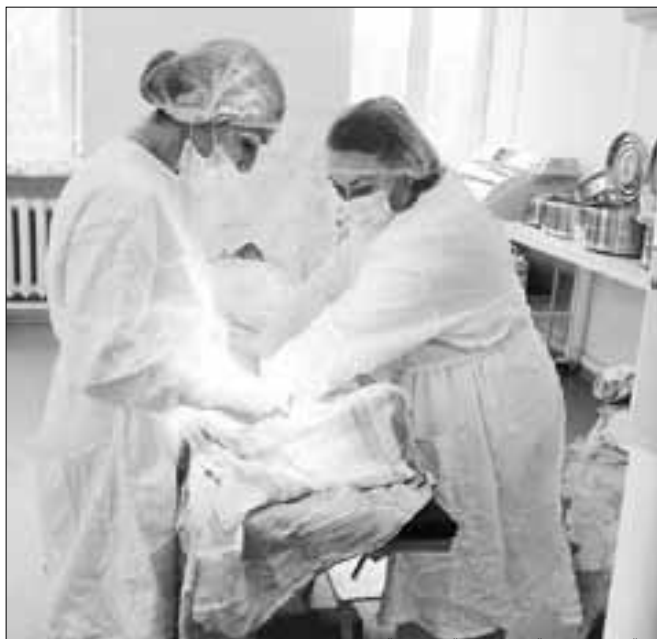
■ ФОТО: ПРЕДОСТАВЛЕНО АРХАНГЕЛЬСКОЙ ГОРОДСКОЙ КЛИНИЧЕСКОЙ ПОЛИКЛИНИКОЙ № 2

Сегодня это крупнейшая поликлиника, которая обслуживает жителей сразу двух округов: Ломоносовского и Майской Горки. Это более 74 тысяч человек, из них 16 300 – дети и подростки.